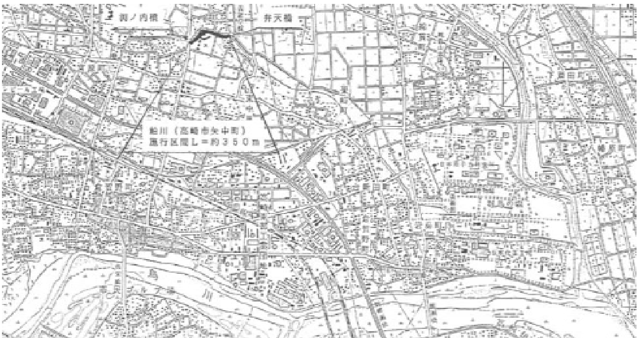
平 面 図（縮尺：1/25,000）